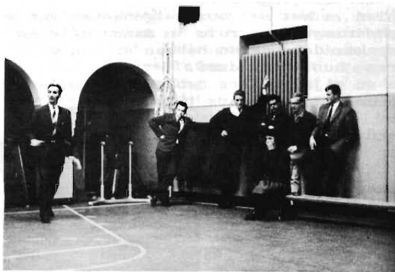
SPEELGROEP VELDEKE 1962